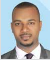
سعادة السيد عبدالجبّار أحمد الطيّب عضو لجنة الحقوق المدنية والسياسية