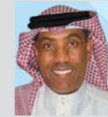
سعادة المستشار الدكتور أحمد عبدالله فرحان الأمين العام للمؤسسة الوطنية لحقوق الإنسان