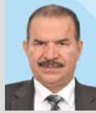
سعادة السيد عبدالله أحمد الدرازي نائب الرئيس، رئيس لجنة الشكاوى والرصد والمتابعة