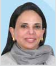
سعادة الدكتورة مي سليمان العتيبي عضو لجنة الحقوق الاقتصادية والاجتماعية والثقافية