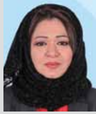
سعادة السيدة جميلة علي سلمان رئيس لجنة الحقوق المدنية والسياسية