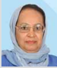
سعادة الدكتورة فوزية سعيد الصالح رئيس لجنة الحقوق الاقتصادية والاجتماعية والثقافية