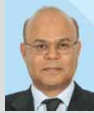
سعادة السيد فريد غازي رفيع عضو لجنة الحقوق المدنية والسياسية